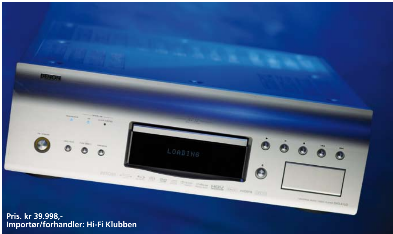
Pris. kr 39.998,- Importør/forhandler: Hi-Fi Klubben

Griegs A-moll konsert har hatt uvurderlig betydning. Og det ikke bare som et gjennombrudd for den unge bergenser som ikke så seg anlediget til å overvære den kongelige premiere i København. Her ble den øyeblikkelig en kjempeslager, for å si det slik, og etablerte den unge musikklereren som da bodde i Oslo som en av verdens mest berømte komponister.